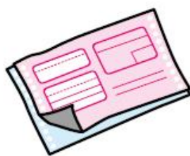
再生の効かない紙 (カーボン紙・油紙など)