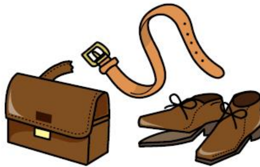
鞆・靴などの革・ゴム製品